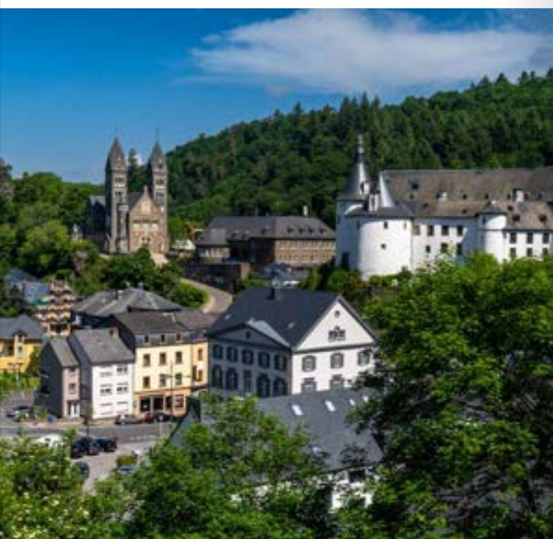
Blick auf die Altstadt und das Schloss in Clervaux (Luxemburg)

Entdecker-Tipp: Starten Sie Ihre Tour im Ort Traben-Trarbach, der für seinen Jugendstilcharakter bekannt ist und von wo aus Sie entlang des Mosel-Radweges in traditionellen Weinorten verweilen können. Der RadBus Untere Mittelmosel bringt Sie am Ende Ihrer Tour wieder zurück zu Ihrem Startpunkt. Weitere Infos unter www.visitmosel.de