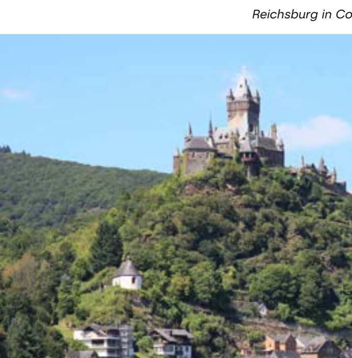
Reichsburg in Cochem

Entdecker-Tipp: Der RadBus Eifel-Mosel bringt Sie nach Gerolstein, von wo aus Sie Ihre Radtour auf dem Kylltal-Radweg in Richtung Mosetal beginnen können. Oder starten Sie Ihre Tour auf dem Eifel-Ardennen Radweg Richtung Daun. Von dort bringt Sie der RadBus bis ins schöne Cochem an der Mosel. Weitere Infos unter www.eifel.info