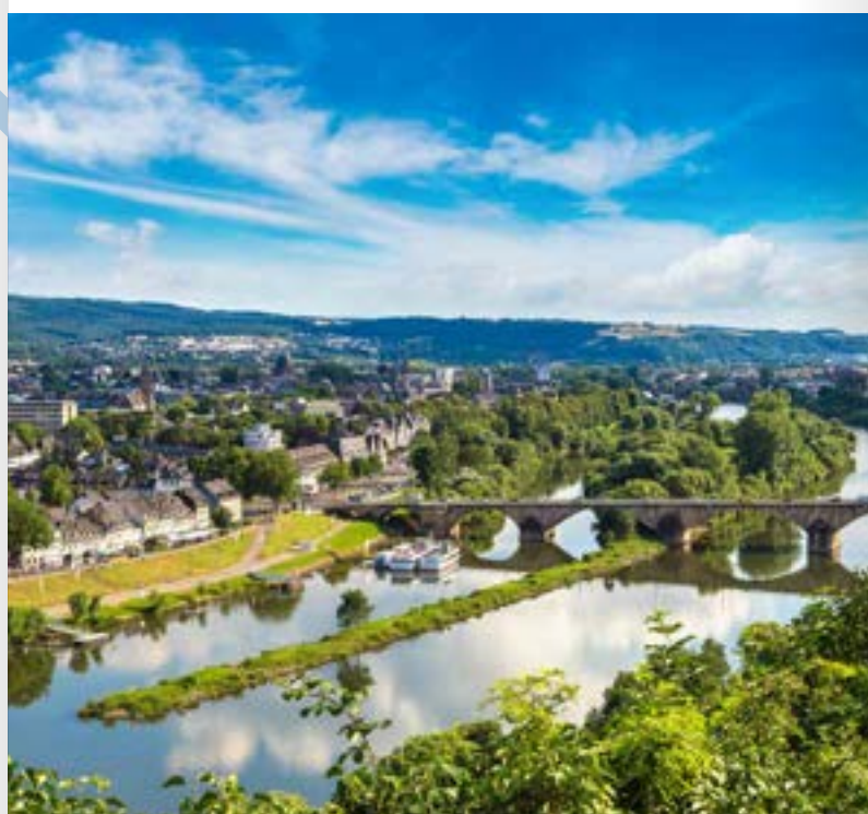
Moselufer in Trier mit der alten Moselbrücke

Entdecker-Tipp: Bei einer Fahrt mit dem RadBus Saueralt bieten sich sowohl Echternach als auch Irrel als Startpunkt einer Tour an, um von dort flussabwärts auf dem Sauer-Radweg Richtung Mosel nach Wasserbillig und Trier zu fahren. Ab Echternach können Sie alternativ auch den Rheinradweg, dem Sie bis nach Trier fahren. Weitere Infos zum Sauer-Radweg unter www.eifel.info/touren/sauer-radweg