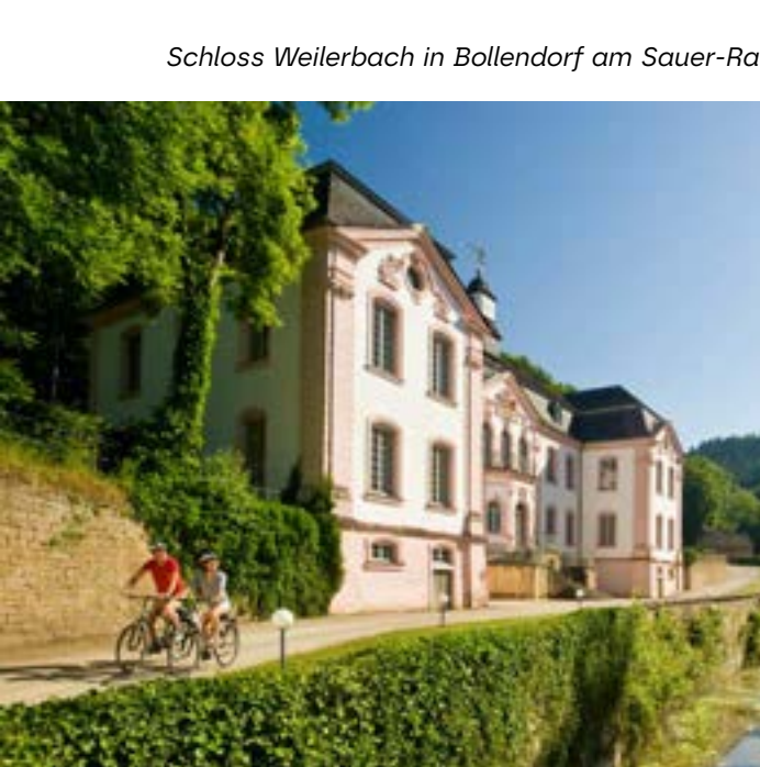
Schloss Weilerbach in Bollendorf am Sauer-Radweg

Entdecker-Tipp: Der RadBus Oberes Saueralt bringt Sie bequem nach Bollendorf. Von dort aus sind es nur noch rund 35 Kilometer bis nach Ettelbrück in Luxemburg, wo ein Bahnschluss besteht. Alternativ können Sie dem Radweg weiter nach Vianden folgen, in das stolze Städtchen in hier zunehmend breiter werdenden Tal der Our. Unterwegs bietet sich mehrfach die Möglichkeit, auf die luxemburgische Seite zu wechseln. Ein besonderes Highlight – und auf der Rückfahrt nach Süden Richtung Wasserbillig nahezu ein Muss – ist das Kleindö Echternach. Weitere Infos zum Sauer-Radweg unter www.eifel.info/touren/sauer-radweg