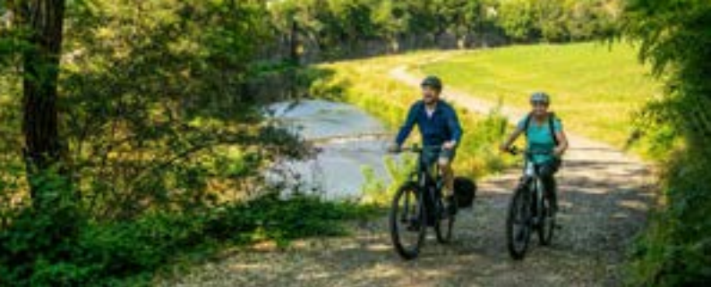
Auf dem Ahr-Radweg