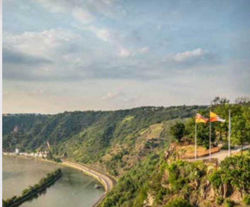
Blick vom Loreley Plateau auf den Rhein

Entdecker-Tipp: Bei einer Fahrt mit dem RadBus Enzthal bietet sich Neuerburg als Ausgangspunkt an, um von dort den Enz-Radweg bis Irrel zu fahren, wo Sie Anschluss an den Sauer-Radweg haben. Oder Sie folgen dem Enz-Radweg weiter nach Norden zu den Bahnradwegen Pronsfeld-Prüm und Pronsfeld-Bleialf-St. Vith. Weitere Infos zum Enz-Radweg unter www.eifel.info/touren/enz-radweg