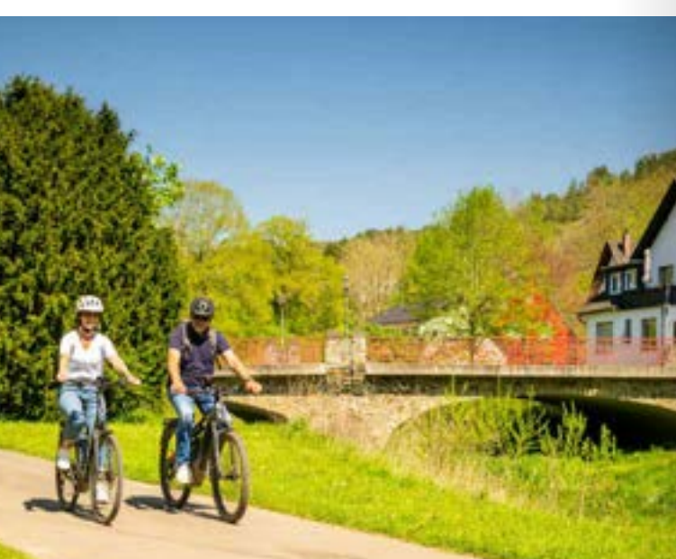
Ahr-Radweg bei Müsch

Entdecker-Tipp: Der RadBus Oberes Ahrtal bringt Sie zum Ausgangspunkt des Ahr-Radweges und zur Ahrquelle nach Blankenheim. Von dort aus können Sie entspannt dem Flusslauf folgen und die abwechslungsreiche Strecke erkunden. Weitere Infos unter www.ahrta.de