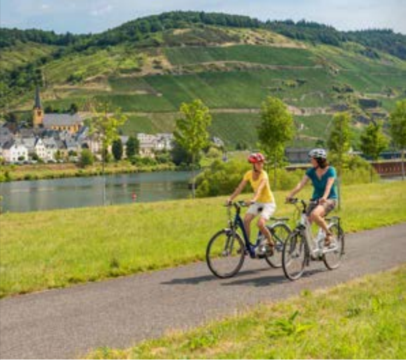
Entspanntes Radeln an der Mosel bei Zeltingen-Rachtig