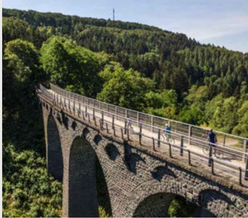
Auf dem Maare-Mosel-Radweg bei Daun