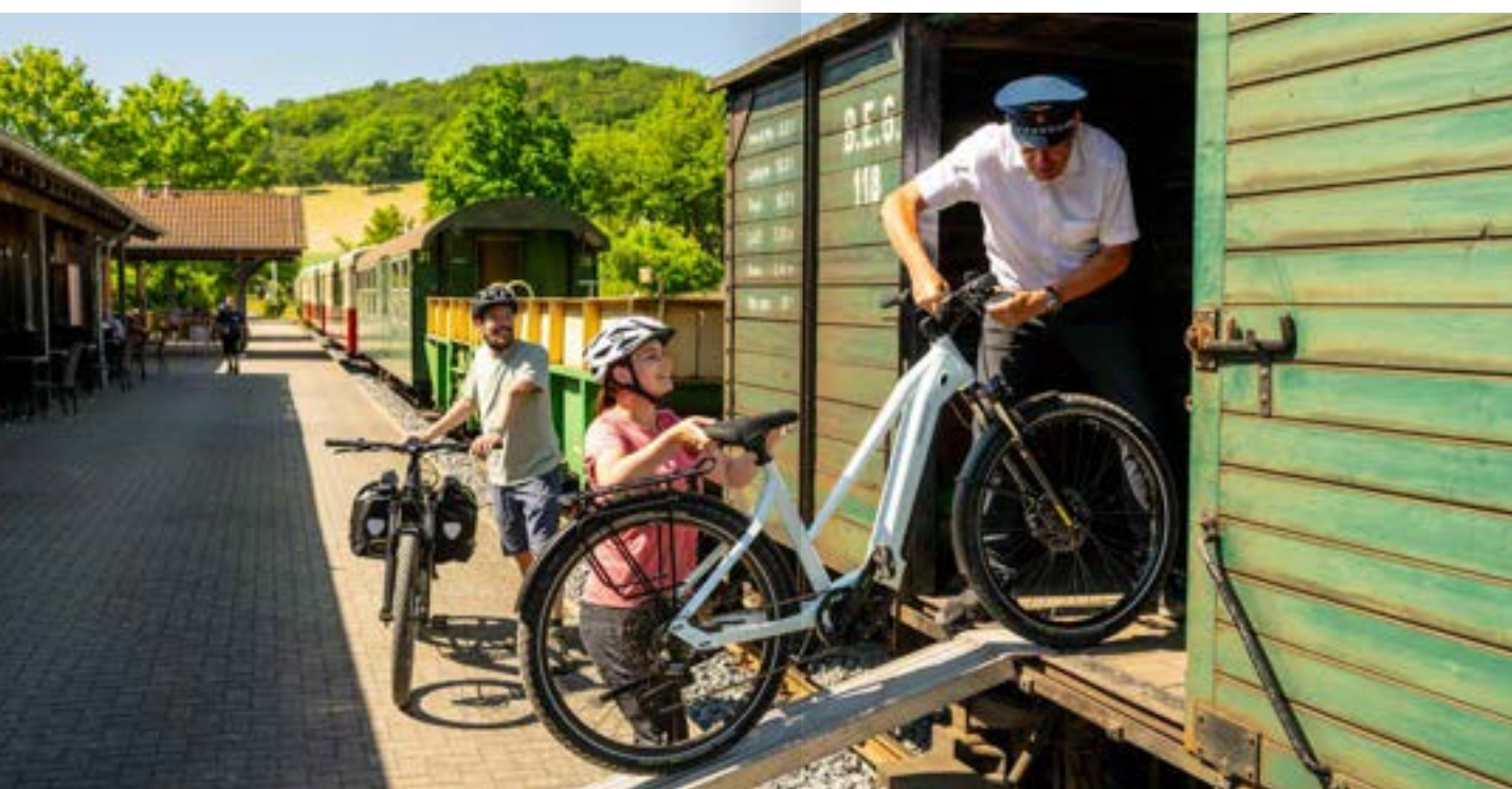
Einfaches Verladen im Vulkan-Express

Entdecker-Tipp: Der RadBus Eifel-Ardennen bringt Sie nach Gerolstein, von wo Sie Ihre Tour Richtung Belgien starten können. Zwischen Prüm und St. Vith ist der Bahntrassen-Radweg besonders gut ausgebaut. Hinter Pronsfeld erreichen Sie das naturnahe Tal des Alfaches. In St. Vith treffen Sie auf den Venn-Radweg mit dem nördlichen Ziel Aachen und dem südlichen Ziel Clervaux. Weitere Infos unter www.eifel.info