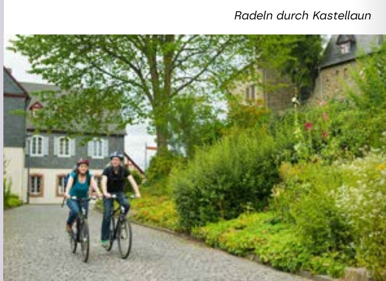
Radeln durch Kastellaun

Stand: 02/2026 · Alle Angaben ohne Gewähr. Änderungen vorbehalten. Dieses Fahrbild ist auf Recyclingpapier mit dem Blauen Engel gedruckt.