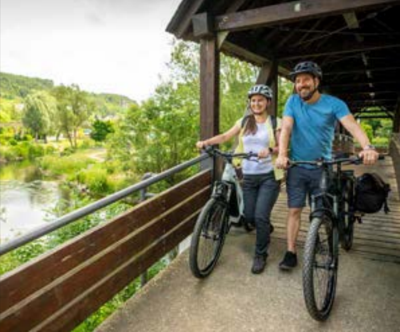
Im Kurpark Gerolstein

Entdecker-Tipp: Starten Sie mit dem RadBus EifelLux in Gerolstein und bestaunen Sie bei einem Zwischenstopp im Prümer Museum die kulturgeschichtliche Sammlung des Prümer Landes und der Eifel. Angekommen in Luxemburg, können Sie die Tour im Schloss Clervaux beenden. Weitere Infos: www.visitluxembourg.com/de