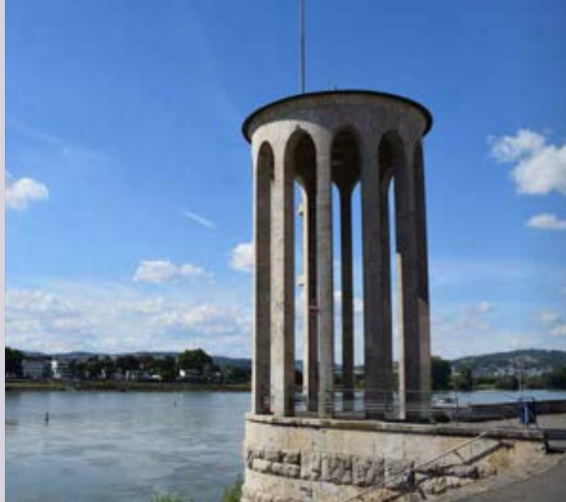
Pegeturm in Neuwied am Rhein

* Relevante Ferien & Feiertage in Rheinland-Pfalz: Osterferien 30.03.–10.04., Karfreitag 03.04., Ostermontag 06.04., Tag der Arbeit 01.05., Christi Himmelfahrt 14.05., Pfingstmontag 25.05., Fronleichnam 04.06., Sommerferien 29.06.–07.08., Tag der Deutschen Einheit 03.10., Herbstferien 05.10.–16.10., Allerheiligen 01.11.